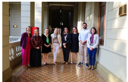
Pontificia Universidad Católica de Chile