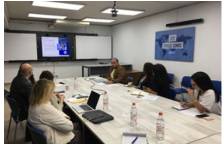
Universidad de Santiago de Chile

Fundada en 1538 en el corazón de la Europa renana, la Universidad de Estrasburgo figuró entre las grandes universidades europeas de investigación desde la fusión de sus tres instituciones fundadoras en 2009. Miembro de redes de excelencia como UDICE a nivel nacional y LERU a nivel europeo, se distinguió por la riqueza de su oferta académica y la calidad de su investigación, que abarcó un amplio espectro disciplinario. Con cerca de 60.000 estudiantes, una parte significativa de ellos internacionales, desarrolló una ambiciosa estrategia de internacionalización basada en cerca de 800 alianzas en el mundo y una participación activa en alianzas europeas como EUCOR y EPICUR. Reconocida por sus importantes contribuciones científicas, ilustradas especialmente por varios premios Nobel, constituyó un actor clave de la cooperación académica internacional.