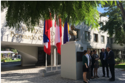
Universidad Bernardo O'Higgins