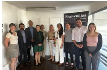
Universidad de Chile

Al término de los encuentros, se identificaron diversos ejes de desarrollo: la reactivación o creación de acuerdos institucionales, el fortalecimiento de los intercambios estudiantiles (especialmente a nivel de magíster y doctorado), el impulso de la movilidad de académicos e investigadores, así como la participación en programas estructurantes como ECOS-SUD o AmSud. Durante las semanas siguientes, se organizaron reuniones entre las distintas unidades de la universidad y sus socios chilenos con el fin de precisar estos ejes de cooperación e identificar proyectos conjuntos.