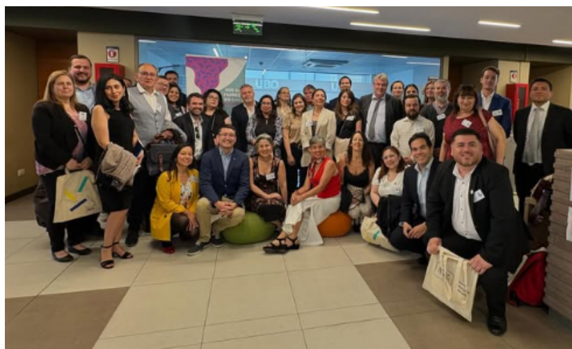
Seminario Le français au Chili, 2025