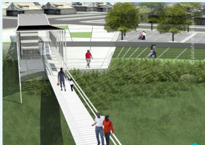
Parque urbano medioambiental que se construirá próximamente en Valdivia

En paralelo, el Instituto Francés de Chile se enorgullece en anunciar la ejecución de un nuevo programa de ayuda a la movilidad doctoral, el Programa Claude Gay, cuyo llamado a postulaciones está abierto desde ya, hasta el próximo 3 de junio de 2016. Este programa está destinado a los doctorantes chilenos inscritos en una universidad en Francia, y se compone de tres opciones: apoyo a la cotutela, apoyo a la co-dirección y apoyo a la puesta en marcha de una cooperación, en vista de apoyar proyectos de cooperación durables. Este programa abarca todas las áreas del conocimiento. Diversos beneficios se entregarán a los seleccionados, tales como el estatuto de Becario del Gobierno francés, la exoneración de gastos de visa y de inscripción en la universidad francesa y del costo de la seguridad social, entre otros.