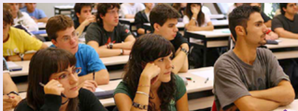
Estudiantes de ambas Universidades participarán en una actividad franco-chilena de internacionalización de sus formaciones

Estas formaciones tienen una amplia trayectoria de cooperación con Francia, ya que un gran número de estudiantes de nivel Master y Doctorado van y retornan cada año a Francia. En este sentido,