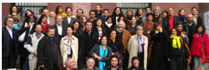
Expertos de la 5ª Escuela Francia-Chile frente a la Universidad de Chile, 2011

P.V.: Constituye un dispositivo de cooperación entre Chile y Francia de gran importancia, conocido y reconocido en el ambiente universitario y académico por la calidad de su quehacer, especialmente sus Escuelas, publicaciones, principalmente. Pero también es un espacio de interacción entre los distintos campos disciplinarios al interior de la Universidad de Chile que ha logrado consolidarse, espacio en el cual tiene un rol activo la Embajada de Francia, al participar a través de su representante en todas y cada una de las reuniones periódicas de debate, decisión y organización. Ello tiene un valor estratégico para ambas partes que han sabido mantener abierta esta iniciativa a otras instituciones universitarias del país, lo que tiene un gran valor.