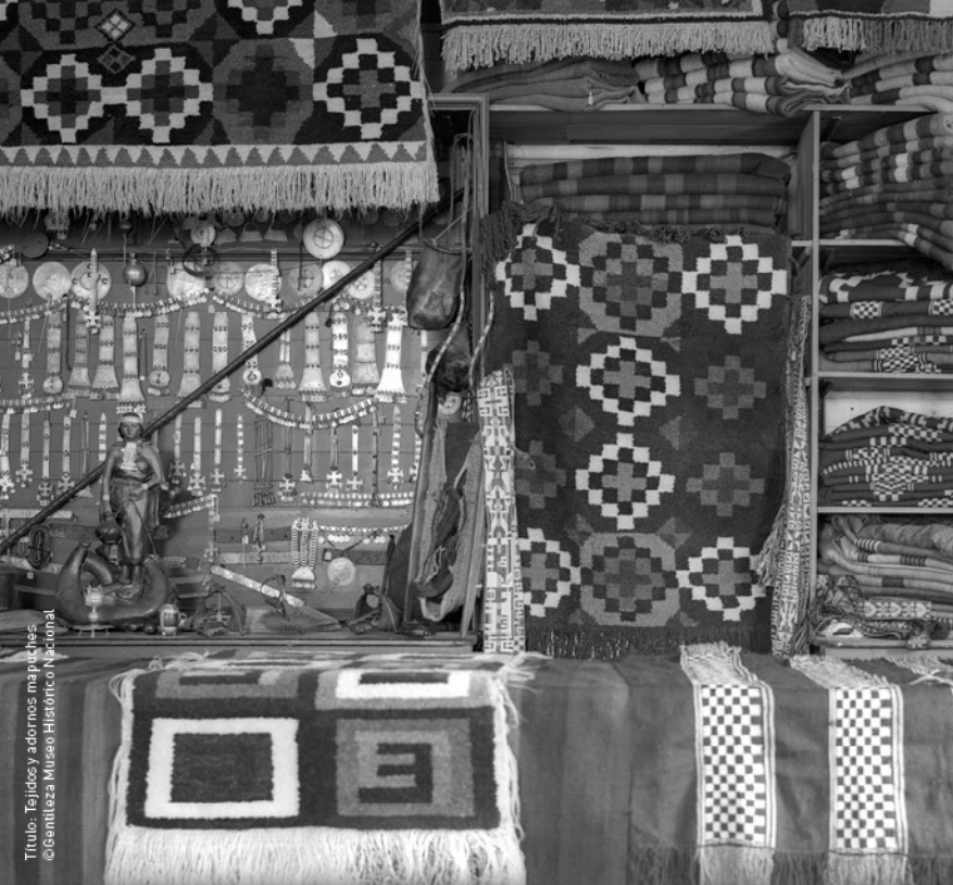
Título: Tejidos y adornos mapuches.