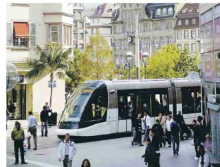
El tranvía de Estrasburgo ha demostrado ser un efectivo medio de transporte.

En esta perspectiva, se han desarrollado estos últimos años los transportes públicos guiados (TPG). Los TPG comprenden tres sistemas distintos: los metros que circulan en vías independientes (sin cruces, en plataforma inasectable) y son generalmente subterráneos. Pueden ser automáticos, como la línea D de Lyon o vehículos automáticos livianos (VAL) actualmente en servicio. La segunda opción son los tranvías, los que se caracterizan por ser vehículos de tipo ferroviario rodado de acero sobre rieles de acero que circulan mayoritariamente sobre la red vial urbana y se conducen en forma manual. La tercera alternativa la constituyen los sistemas sobre neumáticos, los que se caracterizan por tener un desplazamiento sobre neumáticos y una guía por rieles central, por cámara o magnética. Se suele