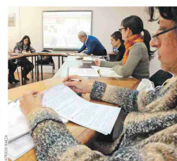
INSTITUTO FRANCÉS DE CHILE