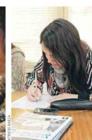
Los cursos de francés son uno de los fuertes del instituto.