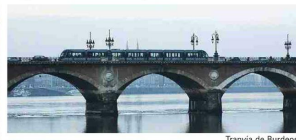
Tranvía de Burdeos.

A partir de los años 1990, el crecimiento explosivo de los centros urbanos y la creciente contaminación ambiental llevaron a plantearse la reintroducción del tranvía en las ciudades medianas pero también en París y en las capitales regionales. De hecho, el aumento de la circulación del transporte en bus de 5% por año. Los motores diesel de la red de buses aumentan la contaminación, principalmente el particulado más fino. En este contexto, el tranvía aparece como una solución de transporte urbano integrado particularmente atractiva. La inversión inicial es mucho menos costosa que la del metro, mientras que la velocidad de desplazamiento es similar y