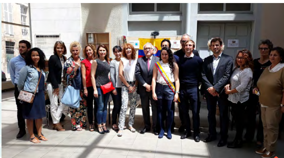
Promoción del programa Estudiar en Poitiers