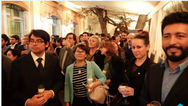
Participantes en la velada de France Alumni

La velada France Alumni Chile reunió a unas 170 personas que comparten ese vínculo universitario, profesional y, sobre todo, afectivo con Francia: profesionales que estudiaron en Francia, estudiantes que están por partir, ex alumnos de liceos franceses en Chile, miembros de asociaciones chilenas con personas tituladas en las Grandes Escuelas francesas (HEC, EHESS, ACFI, INSEAD), asistentes de lengua española, representantes de las Alianzas francesas presentes en Chile y de la red AEFÉ. El Embajador hizo un despliegue del actual panorama destacando la riqueza de la cooperación universitaria franco-chilena de la relación bilateral franco-chilena en