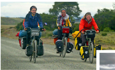
Cada vez son más los turistas franceses que se aventuran recorriendo la geografía chilena.

Múltiples son las actividades que a lo largo y ancho del país llevan en su esencia el idioma y las expresiones culturales del país europeo. Los franceses residentes y los turistas que vienen de allá cuentan con el permanente servicio de los consulados honorarios.