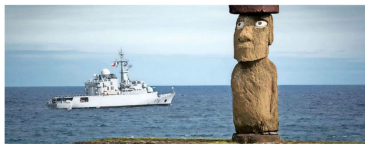
Escalá de la fragata Pantar en la Isla de Pascua en mayo de 2018.