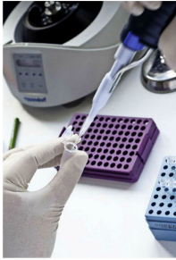
Los intercambios científicos y académicos son una realidad palpable de los estrechos vínculos entre Chile y Francia.

Apoyándose en problemáticas mundiales, las acciones de cooperación bilaterales se inscriben dentro del