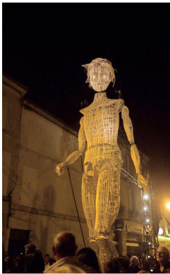
Las expresiones artísticas son parte de la cultura de Francia en Chile.