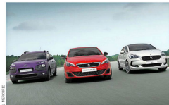
Los autos franceses tienen gran aceptación en Chile.

En muchos ámbitos del quehacer nacional hay una marca francesa.